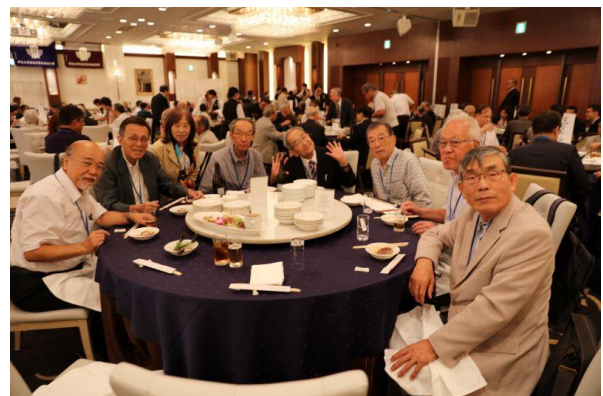
第三部 懇親会にて（日野地域支部テーブル）