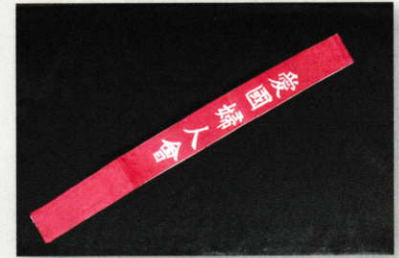
愛国婦人会たすき (明治大学平和教育登戸研究所資料館所蔵)