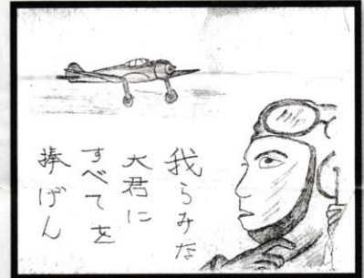
当時の学童疎開児の作品 (複製)