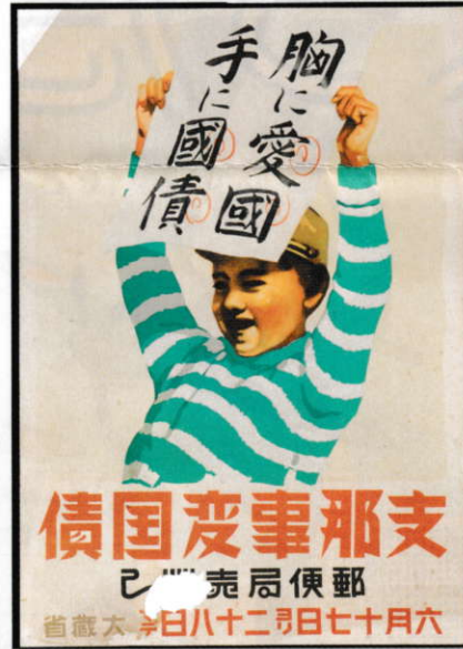
支那事変国債券 (1940年、複製、長野県阿智村所蔵)